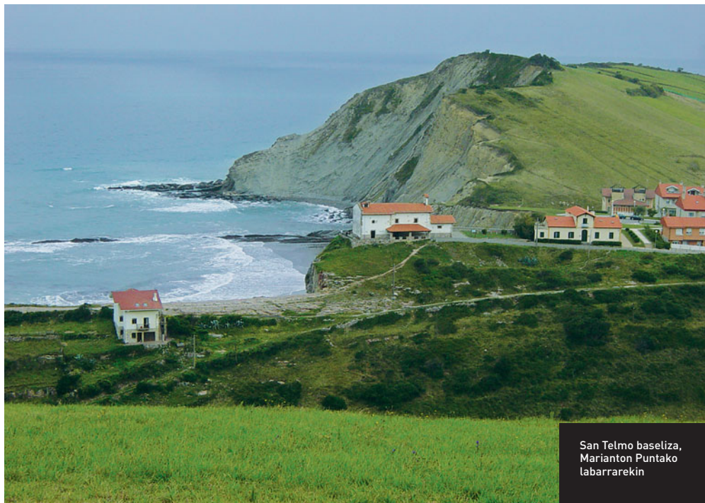
San Telmo basiliza, Marianton Puntako labarrarekin